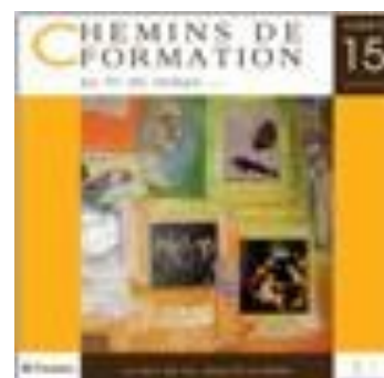
Chemins de traverse Intelligence de l'improbable