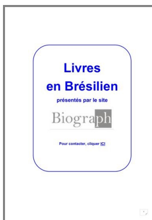
Livres en Brésilien sur le site Biograph