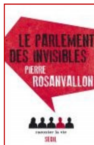
Livre de Pierre Rosanvallon